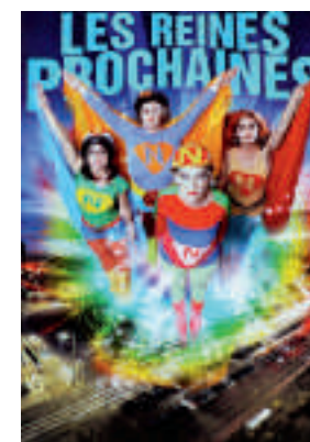
Les Reines Prochaines Auftritt in den Anfängen und heute zum 30 jährigen im Palazzo