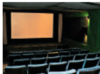
Kinosaal mit 62 Plätzen

Programminformation: www.stadtkinobasel.ch