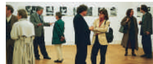
Vernissage Hanimann / Meizl