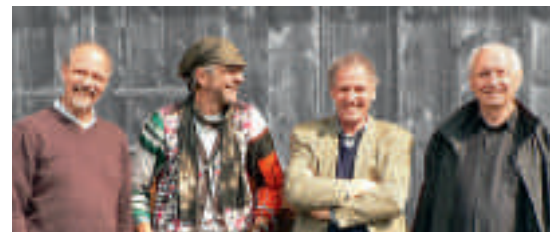
Verwaltungsrat Kulturhaus Palazzo AG 2009